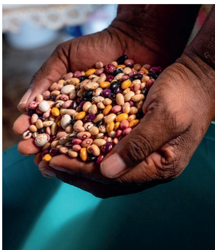
Sementi ottenute dalle piante coltivate nell'orto di Nombasa Mfenge.

Trova maggiori informazioni sul nostro lavoro in Sudafrica su: www.sacrificioquaresimale.ch/sudafrica